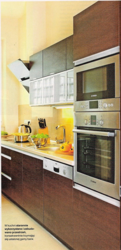
W kuchni starannie wykorzystano i zabudowano przestrzeń, konsekwentnie trzymając się ustalonej gamy barw.

W sypialni centralne miejsce zajmuje obszerne łóżko. Zmieściła się tu również solidna trzydrzwiowa szafa, komoda oraz nocne szafki. Pod oknem urządzono kąpielicę do pracy. Ciekawym rozwiązaniem są półki we wnękach, stworzone przez wybudowanie kolejnej konstrukcji z płyty g-k. Kolorystyka sypialni również jest spójna – ciepłe beżowobrazowe ściany, bardzo ciemne meble i zdecydowane, energetyczne zielono-pomarańczowe dodatki: w oknie roleta firmy Faber, na łóżku narzuta i poduchy z Duki i ceramika z salonu Almi Decor zdobiąca nocną szafkę.