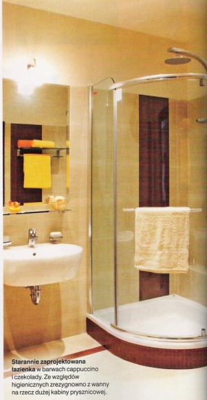
Starannie zaprojektowana łazienka w barwach cappuccino i czekolady. Ze względów higienicznych zrezygnowano z wanny na rzecz dużej kabiny prysznicowej.

Ważny był komfort. Świadczy o tym m.in. dbałość o optymalne wyposażenie łazienki i kuchni. Znajdziemy w nich wszystko, co służy wygodzie lokatorów