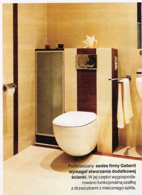
Podwieszany sedes firmy Geberit wymagał stworzenia dodatkowej ścianki. W jej części wygospodarowano funkcjonalną szafkę z drzwiczkami z mlecznego szkła.

Ważny był komfort. Świadczy o tym m.in. dbałość o optymalne wyposażenie łazienki i kuchni. Znajdziemy w nich wszystko, co służy wygodzie lokatorów